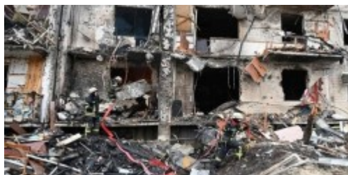
بلائی که روسیه سر اوکراین آورد + تصاویر

شهرهای مختلف اوکراین زیر آتش سنگین نیروهای نظامی روسیه قرار دارند و عکس هایی که منتشر می شوند، نشان می دهد که شهرهایی آرام و زیبا چگونه می توانند در یک فاصله زمانی کوتاه به مکان هایی جنگ زده و ویران تبدیل شوند.