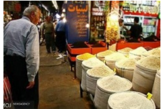
پاسخ به چرایی گرانی برنج