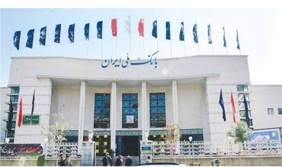
ساختمان بانک ملی خراسان رضوی

کمیسیون هماهنگی بانک‌های خراسان رضوی ۲۲ پیشنهاد برای بهبود محیط کسب و کار استان مطرح کرده است