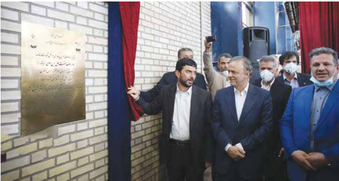
دو طرح ملی صنعتی و معدنی در سنگان خواف به بهره برداری رسید (۱۳۹۸/۲/۲۲)

کشور که برای ۵۰۰ نفر به صورت مستقیم ایجاد شغل کرده سالانه پنج میلیون تن کنسانتره سنگ آهن تولید می کند. با فعالیت تولیدی «واحد صنعتی معدنی توسعه فراگیر سناباد» برای ۵۰۰ نفر به صورت مستقیم اشتغال ایجاد شد. واحد صنایع معدنی فولاد سنگان خواف خراسان دیگر طرح راه اندازی شده امروز است که برای اجرای آن ۴۰ هزار میلیارد ریال سرمایه گذاری صورت گرفت. این واحد صنعتی بخش زیرساختی فولاد