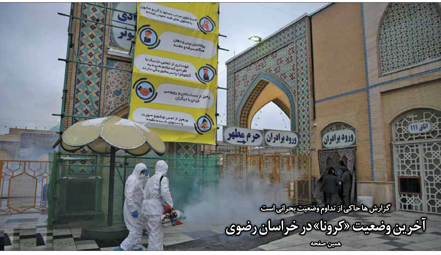
گزارش ها حاکی از تداوم وضعیت بحرانی است آخرین وضعیت «کرونا» در خراسان رضوی همین صفحه

دنیای اقتصاد - انتشار ویروس کرونا تقریباً اقتصاد تمام دنیا را تحت الشعاع خود قرار داده، بسیاری از شرکت های بزرگ که خط تولیدشان به ویژه وابسته به چین بود، تعطیل شده اند و در