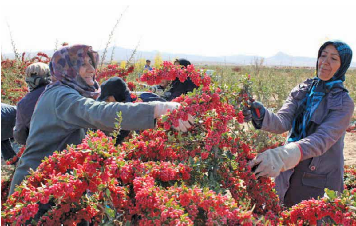
۴حسینی: در سال گذشته ۱۸هزار و ۵۰۰تن زرشک در خراسان جنوبی تولیدشده است

در حال حاضر تنها کشور افغانستان نهال زرشک را در کشور خود کشت کرده‌اما هنوز به تولیدانبوه نرسیده است. در ایران هم برخی استان‌ها همچون اصفهان و البرز زرشک خوراکی کشت می‌کنند اما نسبت به کل تولیدات زرشک رقم چشمگیری نیست و معمولا به دلیل عدم توانایی این استان‌ها در فرآوری، زرشک را پس از برداشت به بیرجند و قاین ارسال می‌کنند. در سال گذشته ۱۸ هزار و ۵۰۰ تن زرشک در خراسان جنوبی تولید شده‌است.