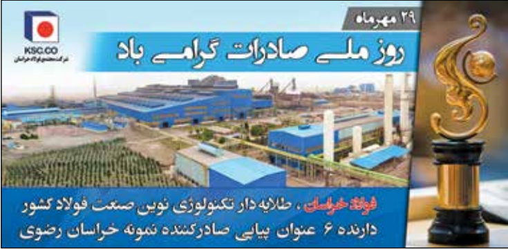
روزنامه صبح ایران