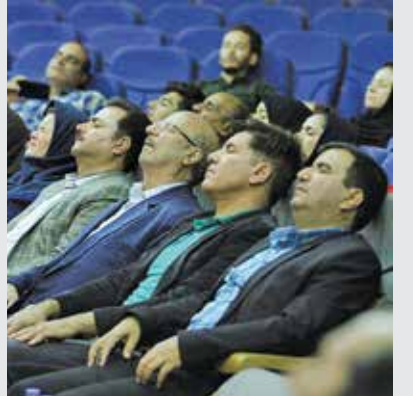
تصویری از نخستین سمپوزیم بین المللی هیپوتیزم ورزشی، در تالار ابونصر هروی دانشکده کشاورزی دانشگاه فردوسی مشهد (۲۴ مهر ماه ۱۳۹۸)