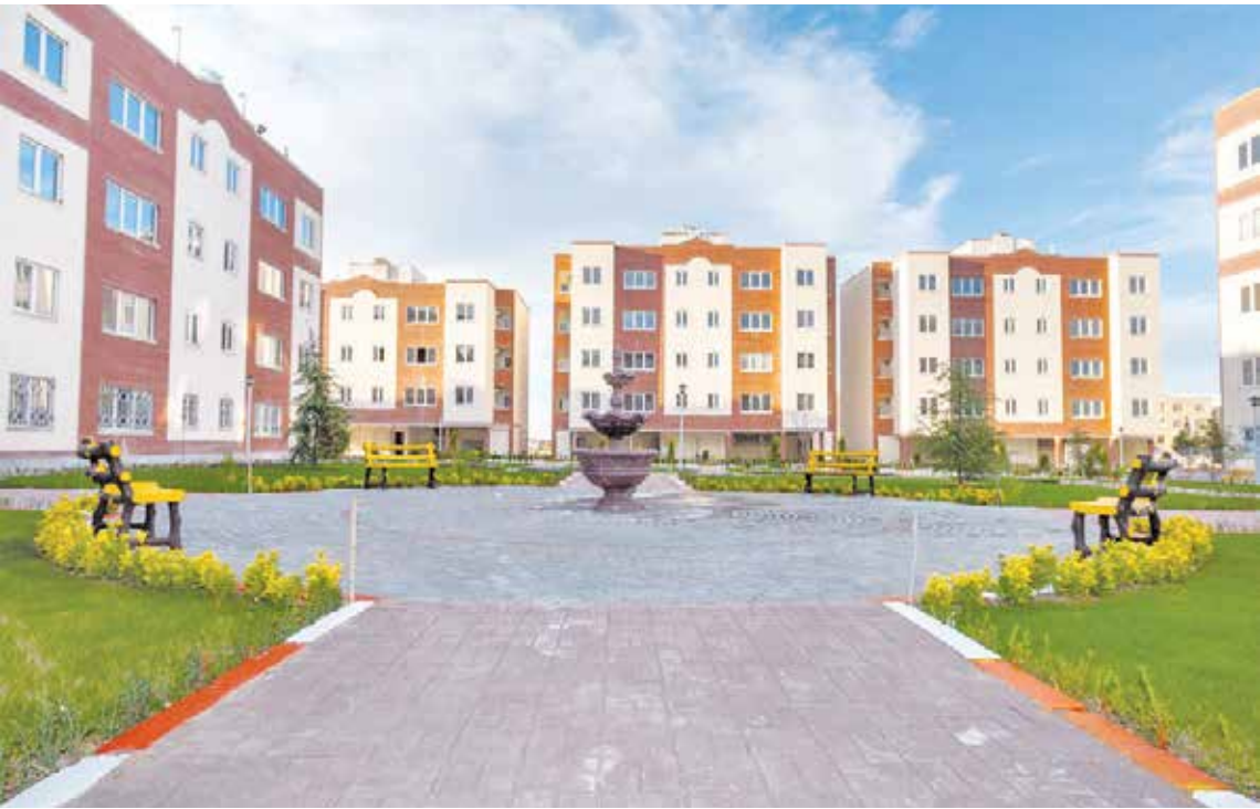
سعید کریم پور خبرنگار