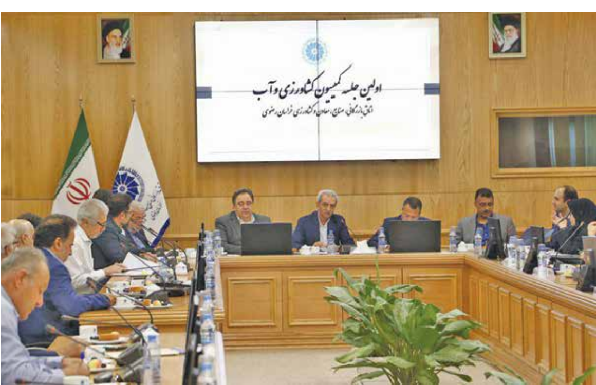
عکس از جلسه عمومی اتاق بازرگانی مشهد

شافعی: تشکل های اقتصادی باید از بطن بخش خصوصی شکل بگیرند