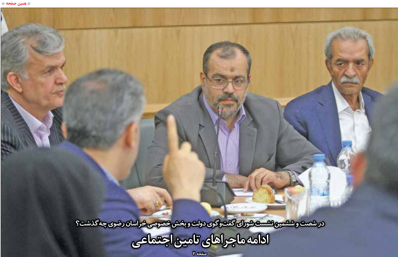
در شصت و ششمین نشست شورای گفت و گوی دولت و بخش خصوصی خراسان رضوی چه گذشت؟