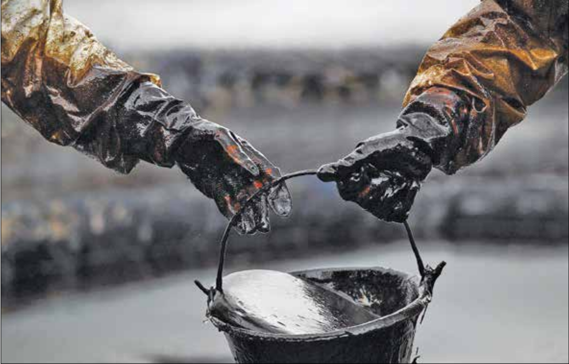
در حال سالی که درآمدهای نفتی کم می‌شود استان‌هایی مانند خراسان رضوی که وابستگی کمتری به درآمدهای نفتی را در اوضاع بهتری با وجود فشارهای مالیاتی دولت پیدایمی‌کند

دنیای اقتصاد – نفت از گذشته تاکنون به صورت هم‌زمان یکی از عوامل توسعه و همچنین تگونی بخش کشورهای پر خور دار از این نعمت الهی دانسته شده است. بسیاری رفت را عامل بیماری اقتصاد کشور می‌دانند؛ با این حال ناگاهی بر حسرت به پیشرفت کشورهای نفت خیز همسایه می‌نگرند. در این کشمکش مشخص نیست بالاخره نفت برای اقتصاد خوب است یا بد. با یاد دانست سیاست‌های کشور ما از زمان آشنایی بانفت، متناثر از این ماده‌ارز زשמند بوده‌ها هیچ‌گاه نتوانسته‌ایم برای کاهش این تاثیر، چاره‌ای بیاندیشیم. به عقیده بسیاری، سال‌های رونق نفتی مخاطرات اقتصاد تک‌محصولی را از یاد مستولان می‌برد. کشورهای زیادی وجود دارند که کمتر از این مخاطرات آسیب دیده‌اند اما قطعاً ایران جزو آن هان نیست. با همه این‌ها مشخص نیست چرا نتوانسته‌ایم گام‌به‌گام اثر سیاه‌نفت بر اقتصاد کشور را کم‌رنگ کنیم. البته نیاید از انصاف دور شد؛ حداقل در خاور میانه و در میان کشورهای نفت خیز، درآمدهای نفتی ایران در بودجه، سهم کمتری نسبت به سایر کشور هادارد. البته شاید اگر ایران هم از تحریم‌ها در امان می‌بود، ما نیز مسیر کشورهای حاشیه خلیج فارس را طی می‌کردیم. در کشور ما برخی استان‌ها مانند خراسان رضوی کمتر از درآمدهای نفتی بر خور دار بوده و همین امر موجب شده که این استان بتواند بدون اتکا به این ثروت ملی، کار خود را پیش بر د. خراسان رضوی در سال‌های اخیر سر ما به گذاری زیادی در حوزه صنایع معدنی داشته‌و از نظر گردشگری نیز رشد زیادی را تجربه کرده‌است. به عقیده برخی کارشناسان، تحریم‌های امروز فرصتی است تا استان‌ها یی مانند استان‌ها مادر مسیری که در پیش گرفته‌متح، محکم بر دارند و الگویی برای سایر بخش‌های کشور باشند.