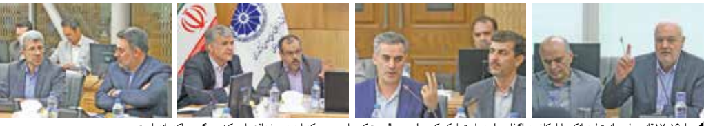
◀ مواد ۱۶ و ۱۷ قانون رفع موانع تولید بانک ها را تکلیف می کرد و این در حالیست که منابع مردمی که باید به خرجه اقتصادی کشور بر گردد را کم نموده است

مشهد به ریاست اتاق ایران را فرصتی مغتنم برای خراسان رضوی خواندند. غلامحسین شافعی رئیس اتاق ایران هم ابتدای این نشست بر لزوم ارائه پیشنهادات سازنده برای حل مشکلات از سوی شورای گفت و گو تأکید و اظهار کرد: در این ساختار تعاملی با حضور مسئولان دستگاه های دولتی و نمایندگان بخش خصوصی، مسائل و مشکلات را مرتب تکرار می کنیم؛ تا به امروز مشکلات با دفعات مطرح و تشریح شده اند و تلاش مسئولان باید این باشد که از این پس به سریع ارائه پیشنهادات سازنده برویم. نمایندگان بخش خصوصی، اصناف و تعاون باید بر ارائه پیشنهاداتی برای مقابله به منظور مشکلات کشور تمرکز کنند. وی این نکته را هم متذکر شد که «اینجا شورای گفت و گوی دولت و بخش خصوصی است؛ بخش خصوصی مدام ایرادات را عنوان می کند و مخاطبش دولت و سایر قوا هستند اما دولت و قوا هم باید آنچه از بخش خصوصی انتظار دارند و مشکلاتی که در این بخش مشاهده می کنند را یاد آوری و مطرح کنند»