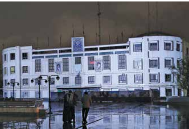
ساختمان مسکن در مشهد در حالی که عوارض شهرداری بر قیمت مسکن تاثیرگذار است.

در سال ۹۷ مجدداً افزایشی در نحوه محاسبات درآمدی پروانه های ساختمانی صورت گرفته، می گوید: طبق قانون موظف هستیم که در سال یک مرتبه عوارض را تغییر دهیم. در سطح شهر ۵ منطقه در آمدی داریم که برخی از مناطق با مناطق دیگر تفاوت قیمتی داشته است. ما مناطق درآمدی در سال ۹۷ را تغییر داده ایم اما عوارض تنها و تنها یک مرتبه در بهمن ماه تغییر پیدا کرده است. سال یک مرتبه عوارض را تغییر دهیم. در سطح شهر ۵ منطقه در آمدی داریم که برخی از مناطق با مناطق دیگر تفاوت قیمتی داشته است. ما مناطق درآمدی در سال ۹۷ را تغییر داده ایم اما عوارض تنها و تنها یک مرتبه در بهمن ماه تغییر پیدا کرده است.