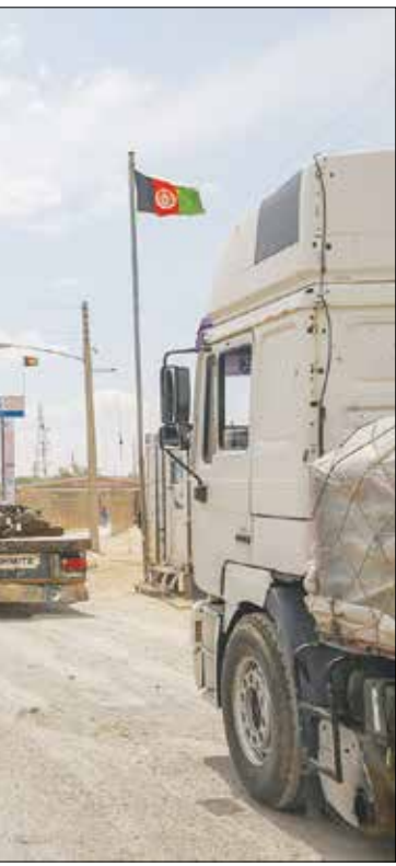
افسانه آختهه خیرنگار