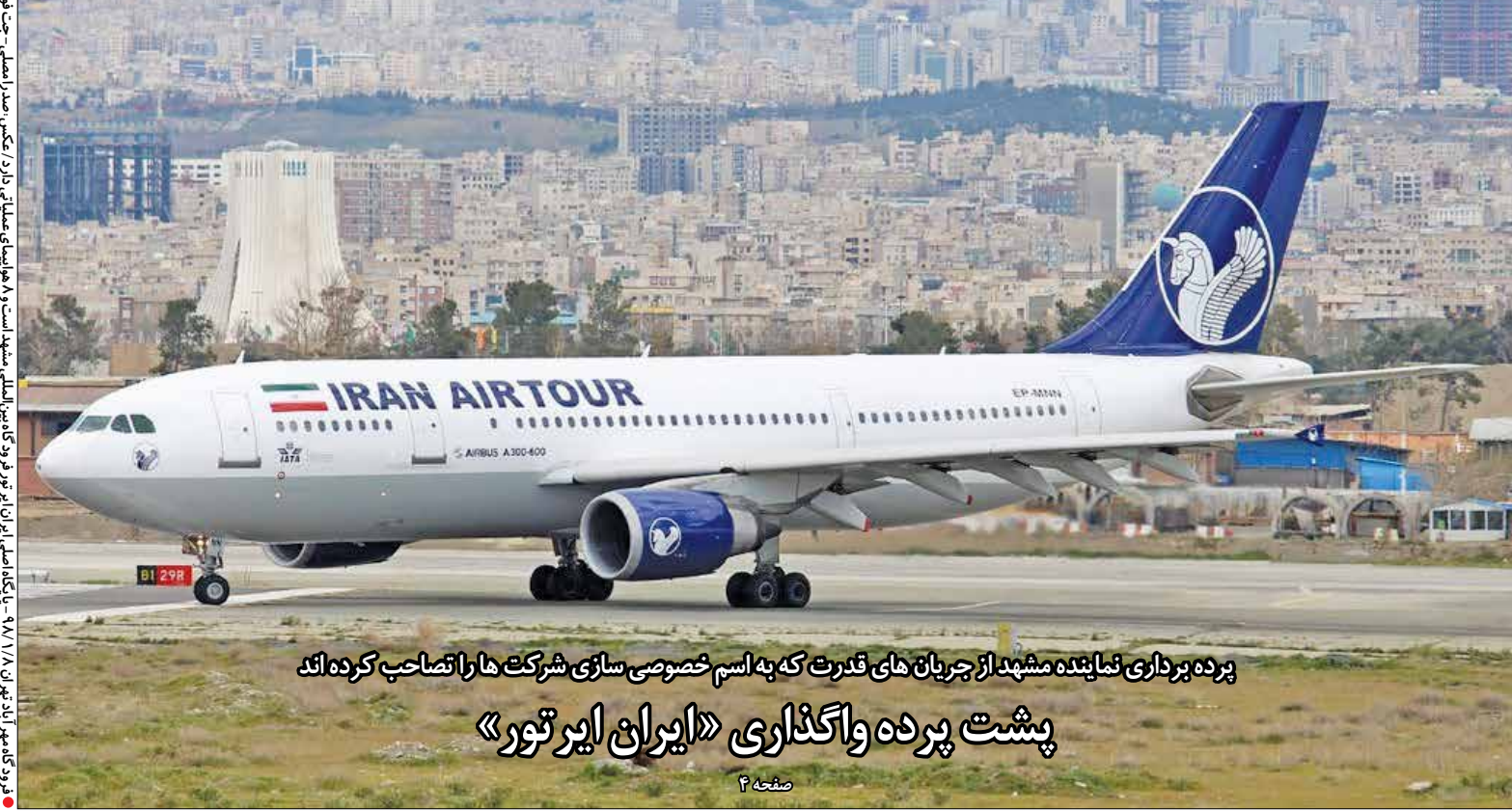
پرده برداری نماینده مشهد از جریان های قدرت که به اسم خصوصی سازی شرکت ها را تصاحب کرده اند

صورت یکطرفه ملغی کرد. در آن زمان ما به عنوان بخش خصوصی وارد موضوع شدیم و جلسات با این نتیجه رسید که سازمان تامین اجتماعی خراسان رضوی در آبان و آذر ماه سال ۹۶ دومر تبیه به تفاهم‌نامه مذکور بازگشت از ابتدای اسفند ماه سال ۹۶ مجدد این تفاهم‌نامه از طرف سازمان تامین اجتماعی استان ملغی شد.