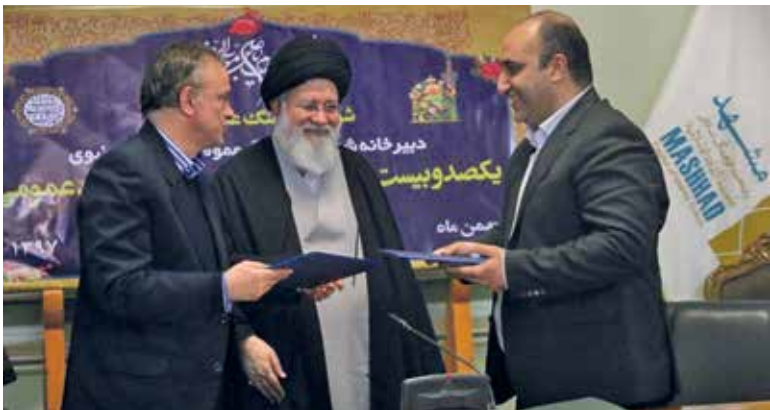
رزم حسینی: ۴۰ سال است که داریم سند می نویسیم و پاوربونت ارائه می دهیم

دنیای اقتصاد - شهرداری مشهد معین اقتصادی منطقه سه خراسان رضوی، علیرضا رزم حسینی استاندار خراسان رضوی و محمدرضا