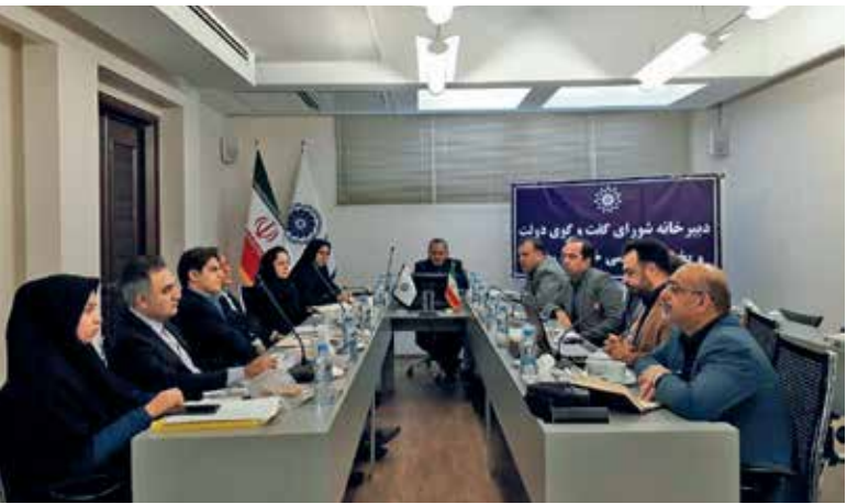
منطقه شگل بگیرد.

وی با بیان اینکه این موضوع را به عنوان یکی از مصوبات پیشنهادی دبیرخانه در شورای گفتگو مطرح خواهیم کرد، گفت: آن منطقه آمادگی برای صدور مجوز ندارد اما در صورت توان صدور مجوز دیگر این موضوع باید مدنظر قرار گیرد.