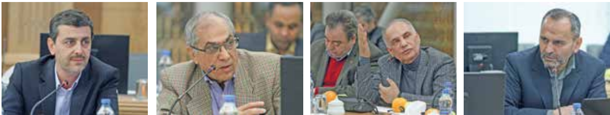
درحالی که ۵۶ درصد مصارف بانکی کشور در تهران صرف می‌شود، سهم خراسان رضوی از این منابع تنها ۳/۱ درصد است