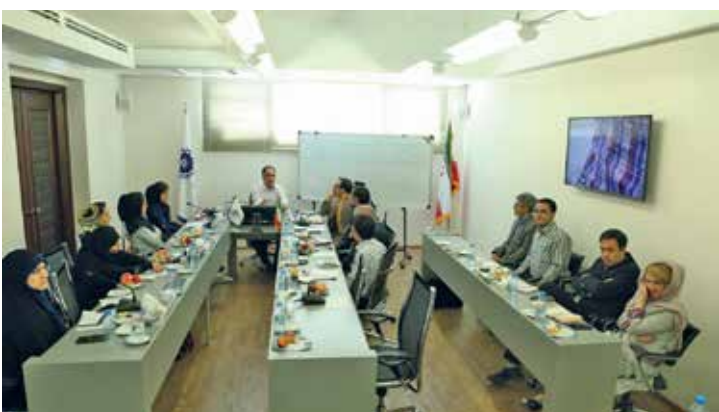
دوره آموزش خبرنگاران اقتصادی در اتاق مشهد