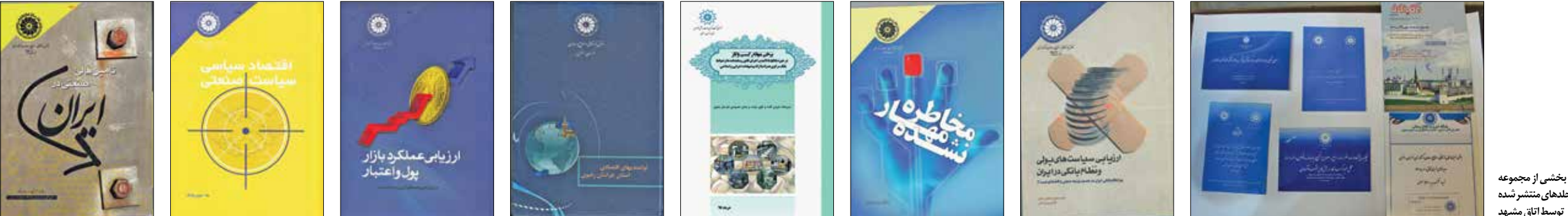
بخشی از مجموعه مجلدهای منتشر شده توسط اتاق مشهد

اطلاع‌رسانی با رویکرد الکترونیک وی با اشاره به برگزاری کلاس‌های آموزشی و همایش‌های تخصصی در حوزه‌های مختلف از سسوی اتاق بازرگانی اظهار می‌کند: بدیهی است اطلاع‌رسانی دقیق و سریع از نتایج و مصوبات این جلسات کار روابط عمومی را با ابعاد زیادی مواجه می‌کند؛ از سوی دیگر فعالان اقتصادی نیاز به اطلاعات و تحلیل دارند که باید بدون واسطه و سریع به دست آنها برسد؛ به همین دلیل از چند سال