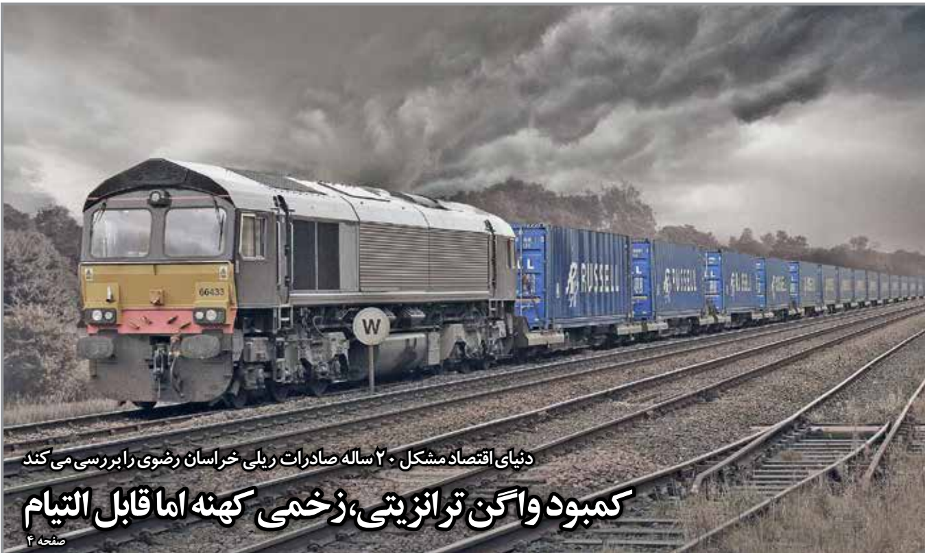
دنیای اقتصاد مشکل ۲۰ ساله صادرات ریلی خراسان رضوی را بررسی می کند کمبود واگن ترانزیتی، زخمی کهنه اما قابل التیام

دنیای اقتصاد - «فیاز کشورهای منطقه به بخش معدن در آینده به سرعت افزایش خواهد یافت و بدین ترتیب، ایران شاید یکی از بهترین گزینه‌ها برای تأمین زیرساخت های صنعتی کشورهای حاشیه خلیج فارس باشد»؛ این بخشی از سخنان غلامحسین شافعی، رئیس اتاق ایران در جلسه کمیسیون معدن و صنایع معدنی اتاق بازرگانی مشهد بود. در این جلسه که با حضور فعالان معدنی خراسان رضوی و مسوولان استانی برگزار شد، نقش کمیسیون معدن اتاق در هم افزایی تشکل های معدنی استان و طرح مشکلات این حوزه مورد بررسی قرار گرفت و ترسیم نقشه راه توسعه معادن در خراسان رضوی مورد تأکید قرار گرفت. رئیس اتاق ایران در این نشست به اشاره به سهیم ۷ درصدی ایران از معادن دنیا و جایگاه قابل توجه در این زمینه، در عین حال سهم ۴ درصدی بخش معدن از تولید ناخالص داخلی کشور را نشان دهنده عقب ماندگی حوزه معدن در ایران تلقی کرد و دوازده فعالان معدنی خواست به نیاز کشورهایی چون قطر، امارات، عمان و... به مواد معدنی در روند توسعه اقتصادی شان توجه کنند و برنامه ریزی بلندمدتی در این زمینه داشته باشند. شافعی از نبود نقشه راه در حوزه های اقتصادی کشور ایران تاسف کرد و گفت: اشکال اساسی ما همین است: ما دارای اسناد بالادستی هستیم اما حرکتمان در مسیر آن اسناد نیست و سواالی نیز درباره این موضوع مطرح نمی شود. وی به شناسایی ۶۷ نوع ماده معدنی در کشور اشاره و اظهار کرد: از این تعداد ۴۳ نوع ماده معدنی در استان خراسان وجود دارد که این خود نشان دهنده قابلیت بالای این استان در بخش معدن است اما با وجود پیش بینی اقدامات مثبت در برنامه های آتی استان برای بخش معدن، در مواردی باز هم نگاهی نامهربانانه به این بخش همچنان وجود دارد.