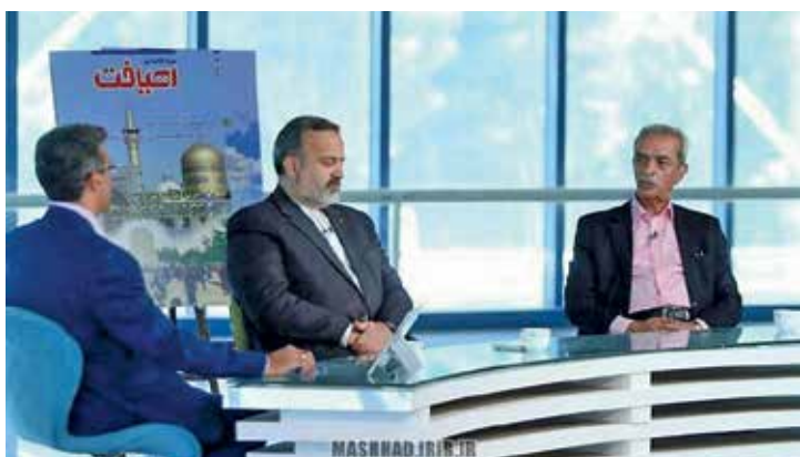
مجموعه تلویزیونی ریافت کار مشترک اتاق و صداوسیما که تابستان گذشته در ۱۲ قسمت از سیمای خراسان رضوی بخش شد

معدنی، بازرگانی، کشاورزی، گردشگری، فنی و هندسی برگزار شد و از نظر بازتاب مطالبات کارآفرینان تأثیر مطلوبی داشته است. سرپرست روابط عمومی و انتشارات اتاق مشهد یادآور می‌شود: برای اطلاع‌رسانی به سرمایه‌گذاران به ویژه هیأت‌های خارجی، اطلاع‌رسانی به زبان‌های خارجی نیز صورت گرفته تا با فرصت‌های سرمایه‌گذاری استان آشنا شوند.