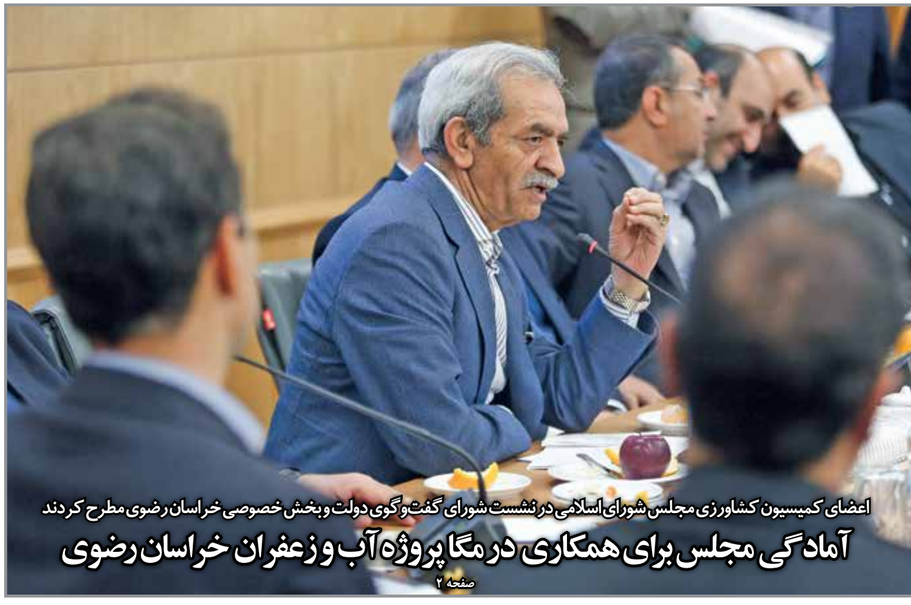
اعضای کمیسیون کشاورزی مجلس شورای اسلامی در نشست شورای گفت و گوی دولت و بخش خصوصی خراسان رضوی مطرح کردند آمادگی مجلس برای همکاری در مگا پروژه آب و زعفران خراسان رضوی