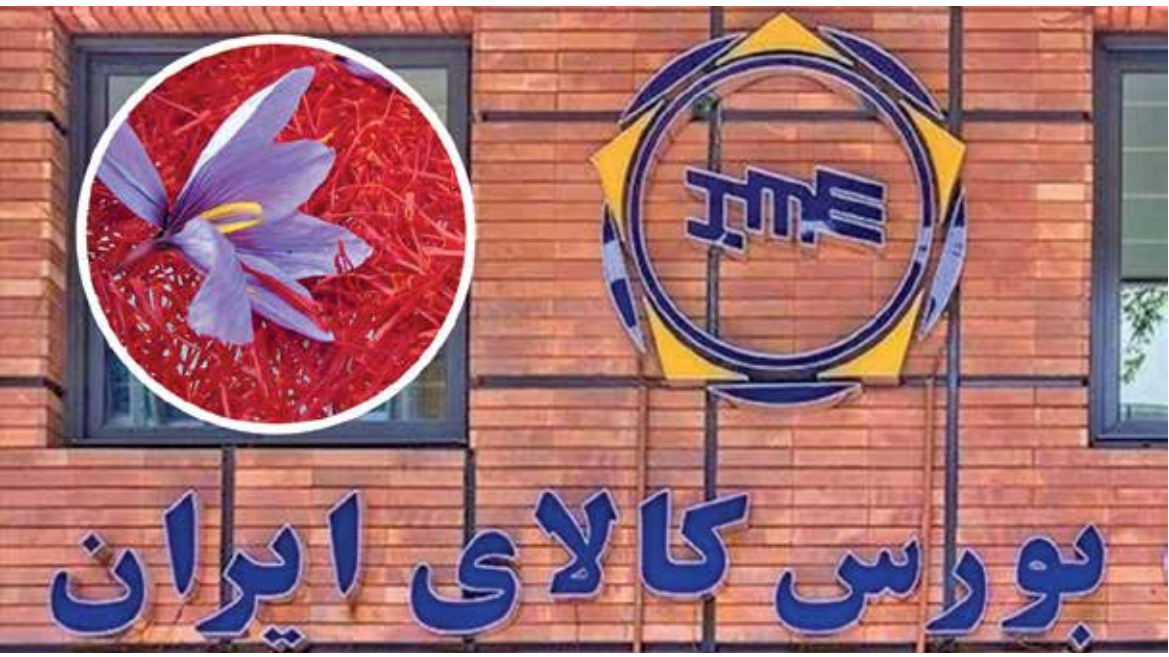
▲ احتشام؛ بورس کالا نمی تواند جایگاه پایین زعفران ایران در جهان را ارتقا ببخشد

رئیس اتاق بازرگانی بیرجند؛ با بررسی پایان نامه های دانشجویان می توان راهکار علمی ارائه داد و مشکل کشاورزان را حل کرد