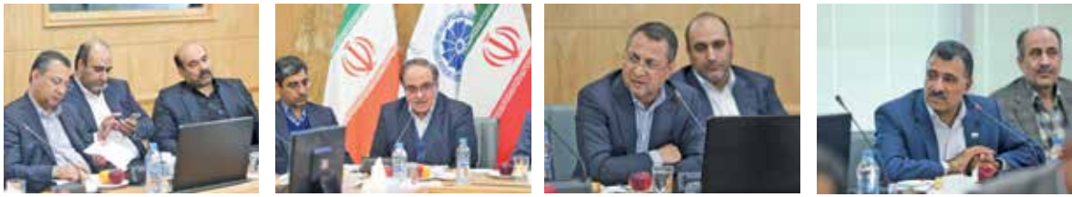
بحران آب در کریدور شرق کشور دو تهدید جدی به دنبال دارد؛ نخست تخلیه مناطق مرزی و دوم افزایش حاشیه شهر مشهد؛ همانطور که الان جمعیت حاشیه شهر از سه استان کشور بیشتر است