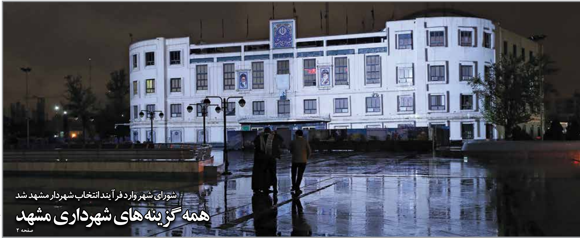
شورای شهر وارد فرآیند انتخاب شهردار مشهد شد