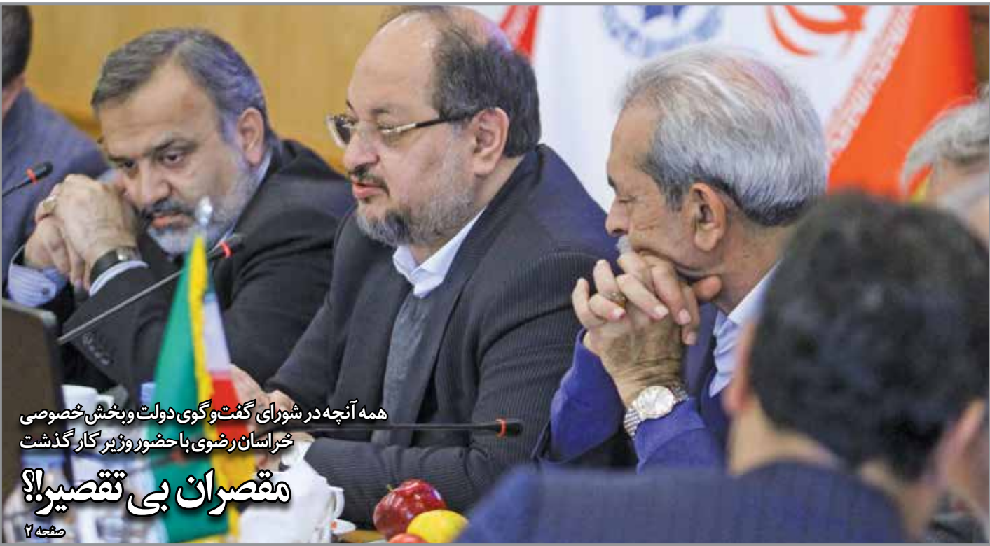
همه آنچه در شورای گفت و گوی دولت و بخش خصوصی خراسان رضوی با حضور وزیر کار گذشت

آنچه مهم است، میزان بازیافت این مقدار تولید زباله های شهری است و این موضوع به گفته کارشناسان در واحدها و کارخانه های بازیافت مشهد تا ظرفیت حدود یک هزار تن انجام می شود. حاصل فعالیت واحدهای بازیافت در مشهد، تولید کمپوست است که از طریق روش های مختلف صورت می گیرد و در نهایت، این کودها باید به دست مشتری ان که عمدتاً کشاورزان هستند، برسد، اما آنچه در این میان باید به آن توجه ششود، این است که تولید کمپوست از زباله های شهری و خانگی در مشهد آیا به همین راحتی داستان ساده ای دارد یا خیر؟