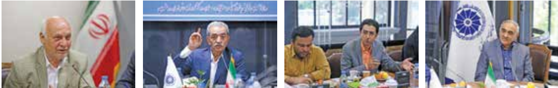
شافعی، در حال حاضر مهمترین مشکل حجم نقدینگی در کشور است

کشور خسارت فراوانی متحمل و منابع زیادی تلف شد. وی درباره پیشنهاد استفاده از ارزهای خانگی برای رشد اقتصادی گفت: دو سال پیش پیشنهاد دادم که روندی ایجاد شود تا از ارزهای خانگی در بخش تولید استفاده کنیم، در این زمینه خیلی تلاش شد و در نهایت موفق نشدیم به مسئولان بقبولیم که این کار انجام شود.