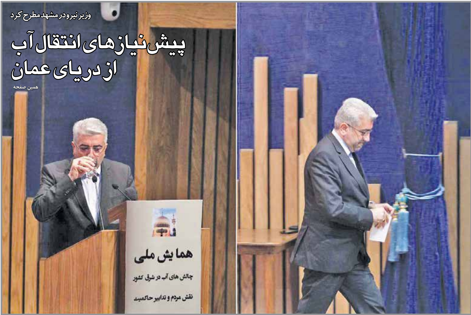
وزیر نیرو در مشهد مطرح کرد