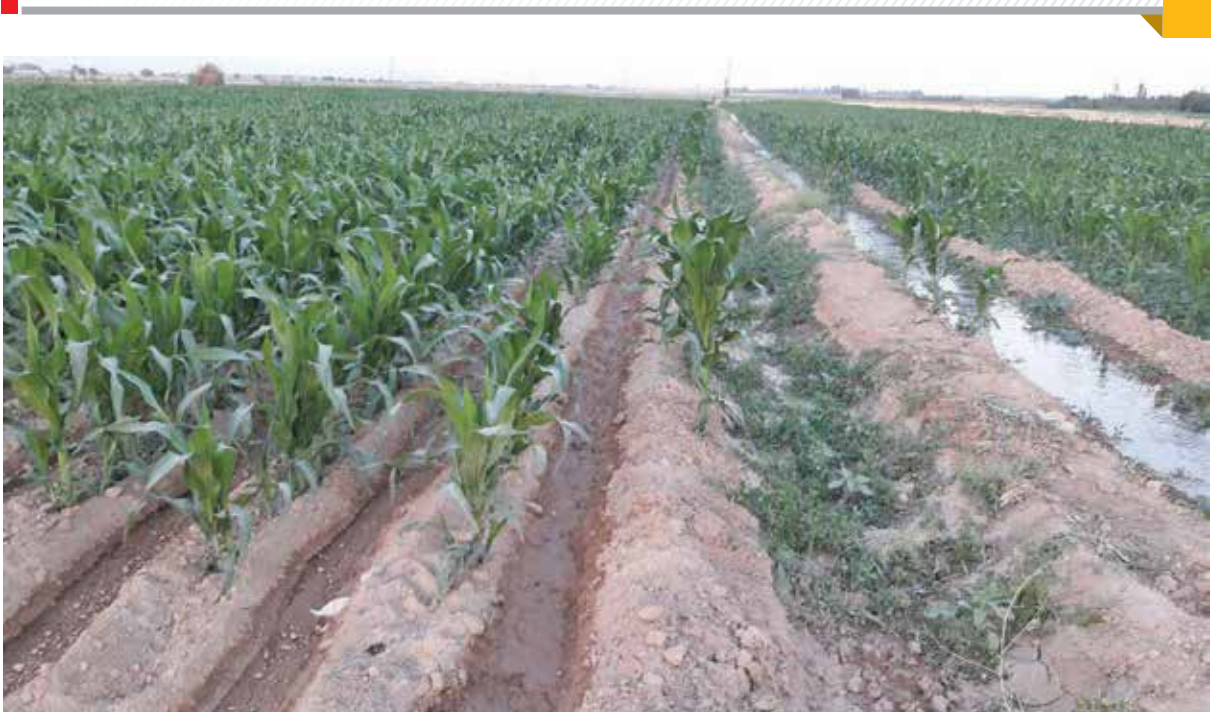
آبیاری غرقابی مزرعه ذرت در روستای خواجه جراح

زیر کشت پسته داشتیم و الان ۴۵ هزار هکتار باغ پسته داریم و اینها در طول زمان میسر است.