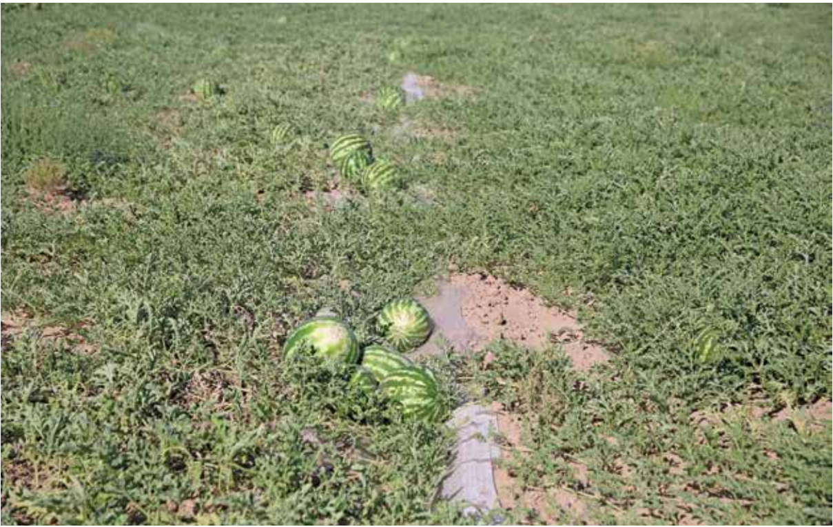
در برنامه کنونی سازمان جهاد کشاورزی در اصلاح الگوی کشت باز هم محصولاتی مثل خربزه، هندوانه و چغندر کشت می‌شود

شاید امروز نباید با وضعیت اسفناک کنونی در حوزه آب روبرو می‌شدیم.