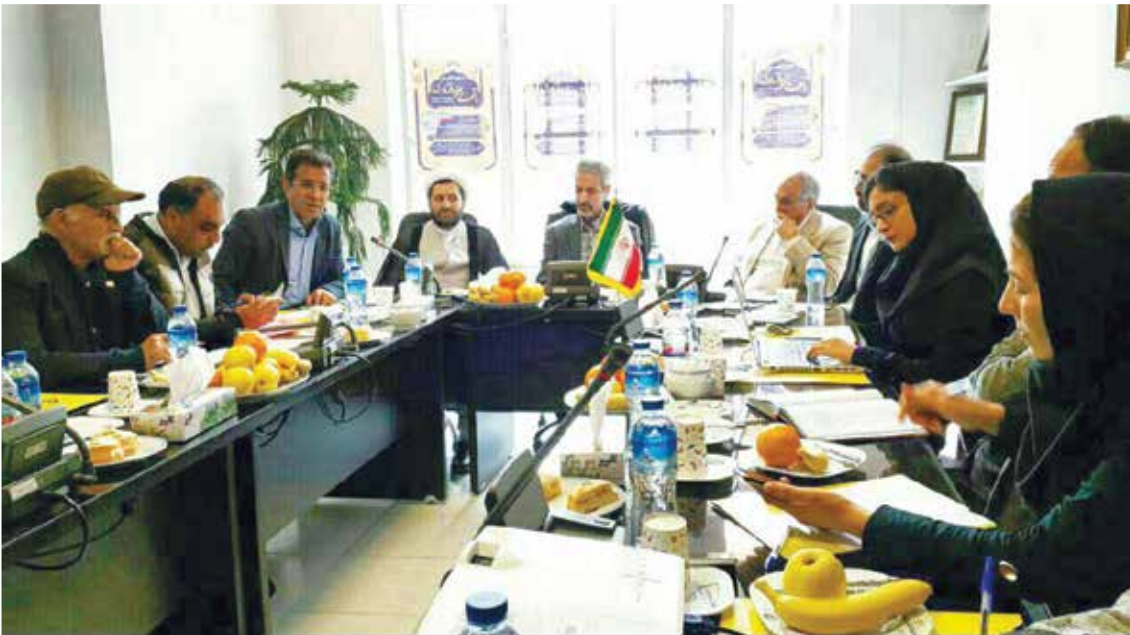
▲ سرمایه‌گذاری در حوزه علم و فناوری در کشور ما ناکافی و حتی ناچیز است