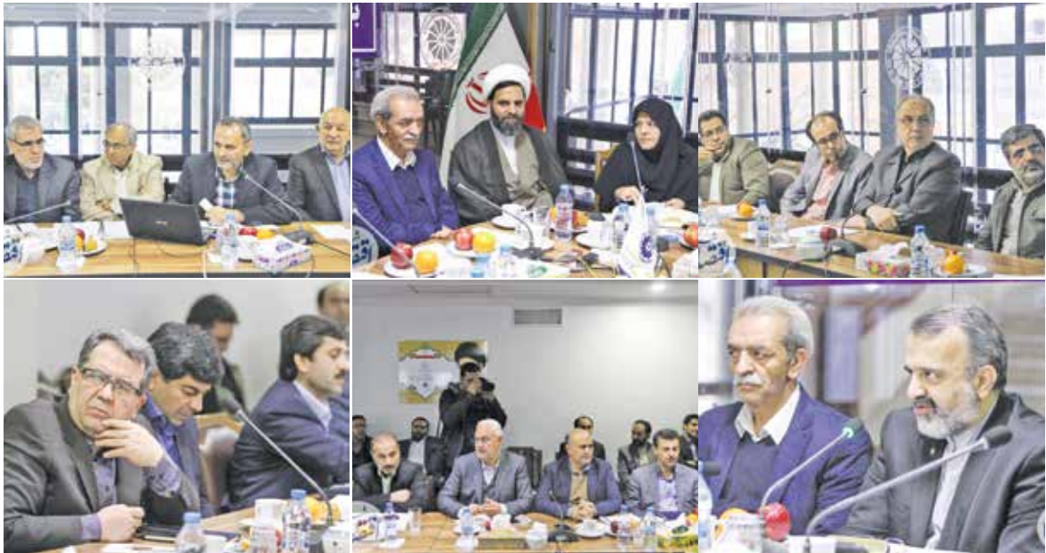
جلسه نشست استانی خراسان رضوی، دوشنبه

دنیای اقتصاد- چهل و نهمین نشست شورای گفت‌وگوی دولت و بخش خصوصی خراسان رضوی با بررسی چند دستور کار و ارائه آخرین اخبار و اطلاعات اقتصادی از سوی رئیس اتاق بازرگانی ایران و استاندار خراسان رضوی در محل اتاق بازرگانی مشهد برگزار شد؛ فراهم کردن امکان تهاتر ۳ درصد سهم شهرداری‌ها از مالیات بر ارزش افزوده، طرح موضوع مغایرت بخشنامه خرداد ماه سال ۹۱ بانک مرکزی با ماده ۲۱ قانون چک درباره تعیین مدت هفت سال برای رفع سوء اثر از چک برگشتی و طرح مباحث مالیاتی از جمله نحوه مواجهه با اجرای ماده ۱۹۸ اصلاحی قانون مالیات‌های مستقیم و رای هیات عمومی دیوان عدالت اداری از جمله موضوعاتی بود که در این جلسه مورد بررسی قرار گرفت.