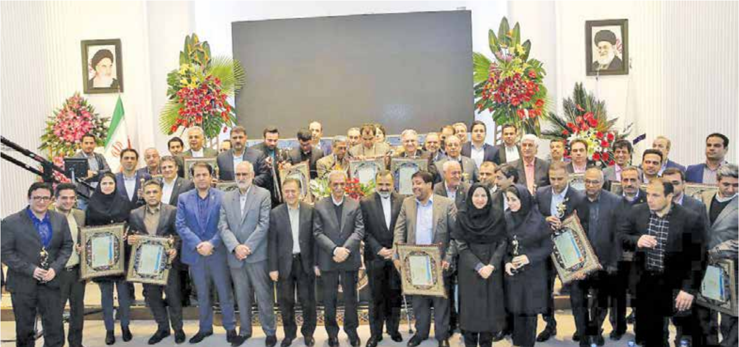
کتایم مسعودی استاندار خراسان رضوی

افزود: آنها باید بتوانند از این نمونه بودن خود و عنوانی که کسب می‌کنند استفاده کنند و با این کار رقابت بیشتری ایجاد خواهد شد.