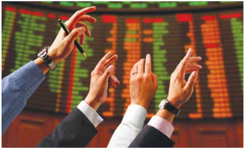
سازمان بورس بدون حمایت قوه قضائیه نمی‌تواند برای حمایت از سهامداران خرد کاری انجام دهد

این کارشناس مسائل اقتصادی با اعتقاد بر اینکه عمق پایین بازار ما یکی از دلایل عدم تجمع سهامداران خرد است، می‌گوید: وقتی نهایت عرضه سهام شناوری یک شرکت حداکثر به ۱۰ درصد می‌رسد، اتفاق اثرگذاری در روند تصمیم‌گیری‌های شرکت رخ نمی‌دهد بنابراین همان مدیریتی که قبل از عرضه و پذیرش شرکت در بورس اتفاق افتاده، ادامه می‌یابد و نهایتاً عرضه و پذیرشی که در بورس اتفاق می‌افتد اثر خاصی در جذب سرمایه‌گذار در تصمیمات بنگاهداری نمی‌گذارد اما در کشورهای دنیا عمدتاً عرضه سهام شناور و عمق بازار و تعداد افراد جامعه که با بازار سهام آشنا هستند و مشارکت دارند،