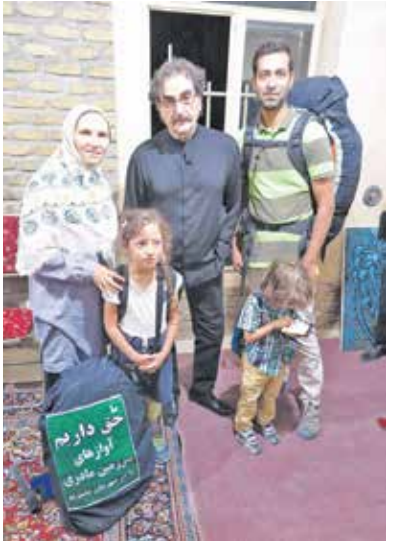
فکرش رامی کردید بانجام این کار. تا این حد رسانای شوید؟

مهرچیان: انتظارش را داشتیم، اما ابتدا که سفرمان را شروع کردیم رسانه‌ها نسبت به پوشش خبری این کار کم لطفی کردند، تا ۳۴ روز اول سفرمان فقط دو رسانه پوشش تصویری انجام دادند. با برخی رسانه‌ها که تماس گرفتیم، می‌گفتند ما از حرکت از زنده شما باخبریم ولی به‌خاطر سیاستهای رسانه‌ها امکان پوشش خبری نداریم. نهایتاً شماره‌ی یکی از خبرنگاران ایلنا را پیدا کردیم و اینگونه ایلنا اولین رسانه‌ای بود که این خبر را منتشر کرد و بعد از آن انگار راه برای باقی رسانه‌ها هم باز شد و ما متوجه شدیم که ما تنها خواهان حقوق شهروندی‌مان هستیم و حرف نامربوطی نمی‌زنیم.