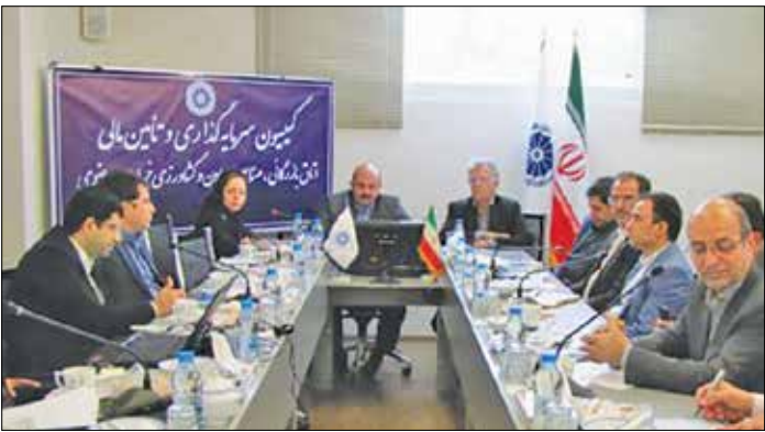
همانگی میان بخش‌های دولتی و بانکی و خصوصی در بسیاری از استانهای کوچکتر از خراسان بهتر است

وی اضافه کرد: راه حل این موضوع برگزاری چنین نشست‌هایی است چرا که تمام بخش‌ها از حمل و نقل و کشاورزی گرفته تا گردشگری و معدن از آن استقبال می‌کنند اما در د مشترک همه آنها این است که با شکل کنونی بازار سرمایه، بخش خصوصی قابلیت ورود به آن حوزه را ندارد. بازار سرمایه باید مشکل ما را ببیند و برای آن نسخه پیدا کند و ما هم برای ایجاد راه چاره در زمینه سرمایه‌گذاری کمک می‌کنیم. رئیس کمیسیون سرمایه‌گذاری اتاق بازرگانی خراسان رضوی یادآور شد: روشی که دنیا به کار بسته تا موفق شده، ادغام صنایع کوچک و متوسط است و صنایع ما هم باید ادغام و بزرگ شوند تا توان عملیاتی و سرمایه خود را بالا ببرند. امیدوارم این دست نشست‌ها حتی اگر در عمل به طور مستقیم ورود پیدا کنند، در بالا بردن سطح آگاهی و ایجاد انگیزه در طرف عرضه برای تطبیق مدل‌های خودش با نیاز روز جامعه و ایجاد انگیزه و تلاش در سمت تقاضا برای اینکه خود را با شرایط تامین سرمایه از بازار سرمایه تطبیق دهد،