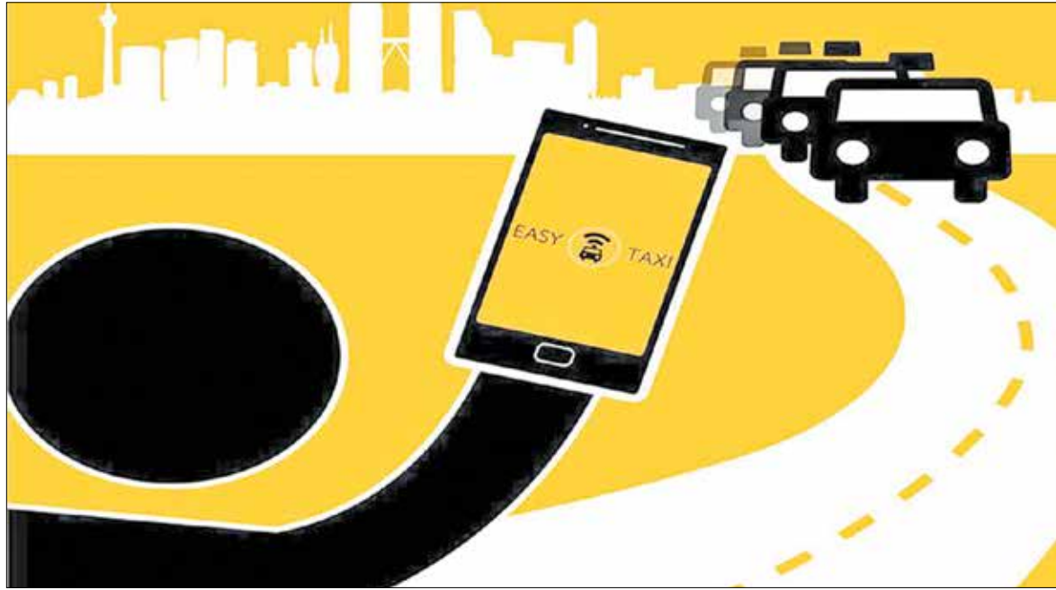
جغرفی: به نفع شهروندان است که تاکسی‌های آنلاین تحت کنترل وارد عرصه رقابت شوند

باشند، به منظور امنیت بیشتر شهروندان برای این شرکت‌ها این الزام وجود دارد که از سرویس‌های داخلی استفاده کنند و تاکسی‌رانان هم این فرصت را داشته باشند که در صورت تمایل به این شرکت‌ها بپیوندند. این کارشناس ترافیک با بیان اینکه روی قیمت‌ها و تعرفه‌های شرکت‌های تاکسی آنلاین شرایط سختگیرانه‌ای لحاظ نشده است، ادامه می‌دهد: هنوز در مراحل اولیه این آیین نامه هستیم و سیاست‌های سختگیرانه را به کار نبردیم.