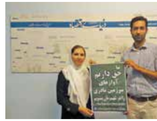
مشروح گفتگو با این زوج مهدی را در شماره بعد بخوانید

در این مجموعه فعالیت می‌کنند، در تصمیم‌گیریه‌ها استفاده شود. حیدری حوزه کتاب را حوزه‌ای پررزینه و پردردسر دانست و افزود: همه ما باید قدردان سرمایه‌گذاران این عرصه باشیم و به این عزیزان برای وسوسا پویانگهداشتن فضاهای فرهنگی کمک کنیم.