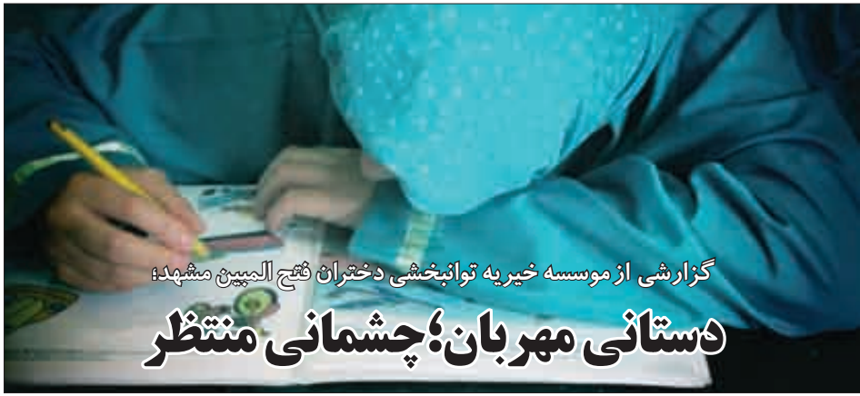
گزارشی از موسسه خیریه توانبخشی دختران فتح المبین مشهد؛ دستانی مهربان؛ چشمانی منتظر

دکتر حجت: خیران ما را پشتیبانی می کنند و سازمان بهزیستی تنها یک سوم هزینه ها را می پردازد