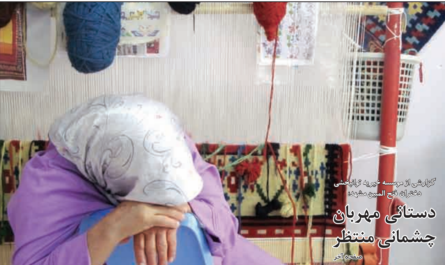
گزارشی از موسسه خبریه توانبخشی دختران قبح المبین مشهد

این روزها اخبار متعددی درباره احیاء سازمان مدیریت و برنامه‌ریزی به گوش می‌رسد. دلایلی از جمله تحریم‌های بی‌سابقه، درآمدهای نفتی انبوه، ضرورت ثبات اقتصادی، توزیع جغرافیایی نامتناسب منابع انسانی و مالی که منجر به افول سرمایه‌های اجتماعی گردیده است، نبود مطبوعات آزاد و از همه مهمتر غیبت چند سال اخیر این سازمان به عنوان یک نهاد کنترلی-نظارتی، ضرورت وجود آن را بیش از گذشته پررنگ ساخته است. اگرچه این روزها بسیاری از کارشناسان اقتصادی از ضرورت احیاء این سازمان سخن می‌گویند اما بسیاری از کارشناسان نیز به تأمل و تدبیر